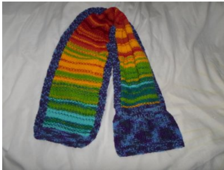
Écharpe température Les températures de l'année 2017 en une écharpe tricotée.

C'est également une écharpe bavarde : l'année et les numéros des mois y sont inscrits avec l' alphabet que l'on trouvera avec les autres grilles . À l'autre bout, j'ai Â« écrit Â» en jacquard : Â« maximales Â», à l'envers, je m'en suis rendue compte trop tard, ça restera à l'envers, et Â« Paris Â».