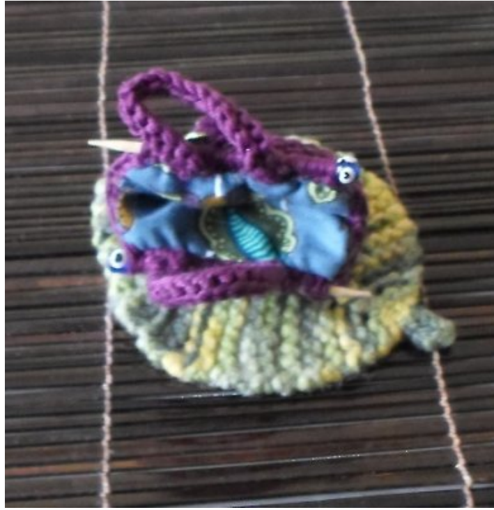
Intérieur Le sac, vue de la doublure.