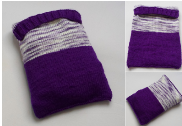
Grande poche bicolore Étui à rabat bicolore.