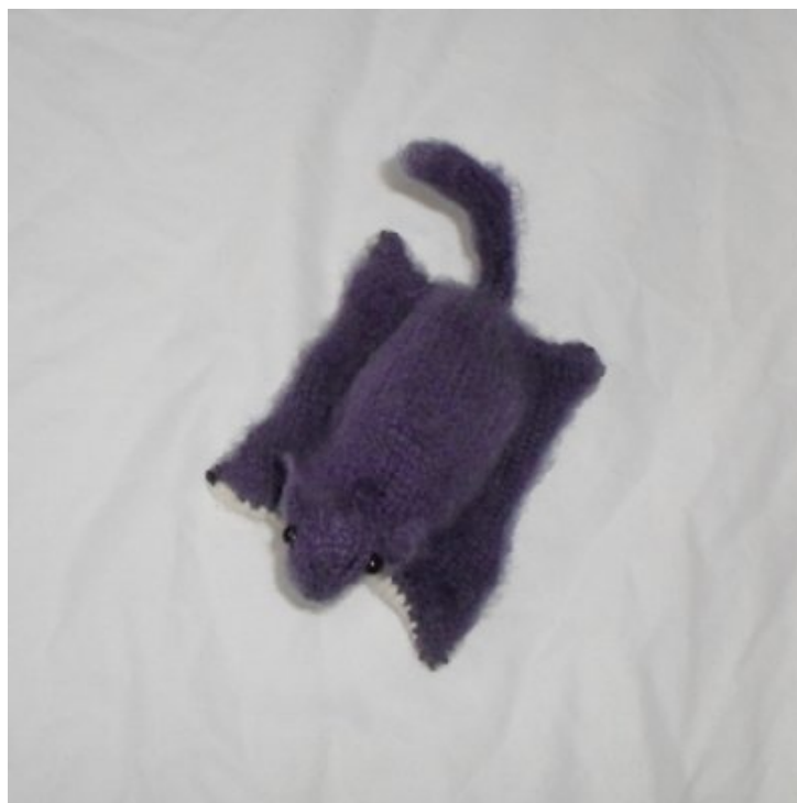
SPIP Un petit polatouche tout doux.

Il n'a besoin que de moins de dix grammes de fil à tricoter par couleur, un peu de rembourrage et des yeux de sécurité pour jouet (ils peuvent être remplacés par des broderie). Il se tricote vite et ne comporte que six pièces. Vous pouvez éventuellement tricoter la tête et la queue en rond.